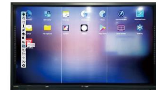
DonviewBoard for Android