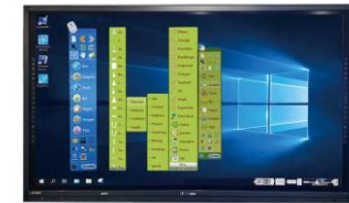
DonviewBoard for Windows